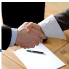
Incontro con il cliente

"Non devi fare altro che affidarci il bancale e noi penseremo a farlo giungere a destinazione in breve tempo, sfruttando i network dei Corrieri Espresso."