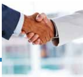
Incontro con il cliente

Mail Boxes Etc.: "Grazie ad accordi esclusivi con società esportatrici Mail Boxes Etc. è in grado di risolvere questo problema. Può quindi spedire vino anche negli USA per conto di quelle aziende che non hanno le dovute autorizzazioni."