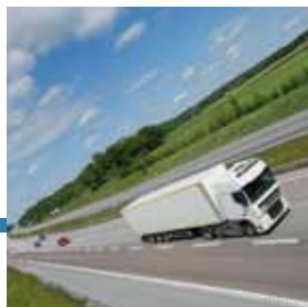
Movimentazione e spedizione

“Potrai monitorare l'intero processo della spedizione dal ritiro alla consegna, via computer, come se fosse una normale spedizione espressa.”