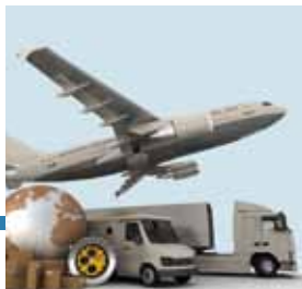
Spedizione e controllo costante

"Gestiremo la tua spedizione con il servizio contrassegno in modo tale che alla consegna il corriere ritiri contestualmente il pagamento della fornitura."