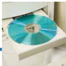
Installazione software gestione spedizioni