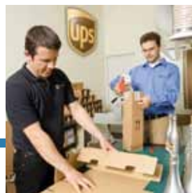
Servizio imballaggio professionale