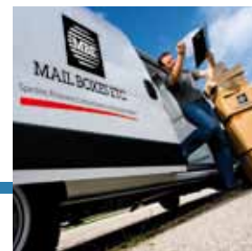
Ritiro colli in azienda