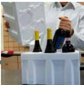
Cantinette termiche e antiurto

"Noi ritireremo le bottiglie e le inseriremo nelle nostre apposite cantinette, testate e certificate proprio per il trasporto con corriere, in modo tale che le bottiglie arrivino integre a destinazione."