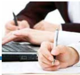
Consulenza e servizio personalizzato