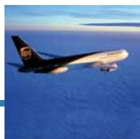
Spedizione e controllo costante

"Devo ritirare dei pezzi di ricambio da un mio fornitore a Roma, ma anziché farmeli spedire alla mia sede di Milano, devo inviarli direttamente al mio Cliente in UK perché sono in ritardo con la produzione..."