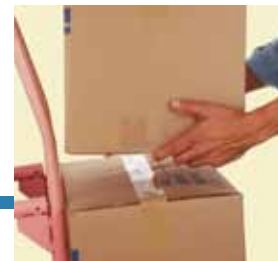
Ritiro colli in azienda