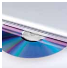
Installazione software gestione spedizioni