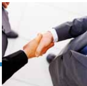
Incontro con il cliente

"Effettueremo la spedizione con un servizio garantito in modo tale da consegnare i tuoi prototipi nei tempi richiesti. Inoltre ne seguiremo passo per passo la spedizione per verificare che tutto proceda correttamente."