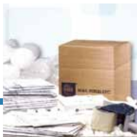
Materiali per imballaggio

Mail Boxes Etc.: "Pensiamo noi a ritirare il quadro e a imballarlo con una cassa di legno fatta su misura. Inoltre gestiremo noi la spedizione e la controlleremo passo per passo fino alla consegna."