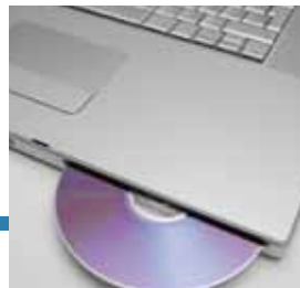
Installazione software gestione spedizioni